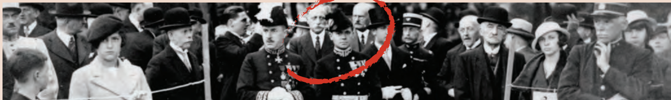
Aux côtés du préfet du Finistère, Jean Moulin, sous-préfet de Châteaulin, assiste à une cérémonie au monument aux morts, avec le maire et le conseiller général du canton.