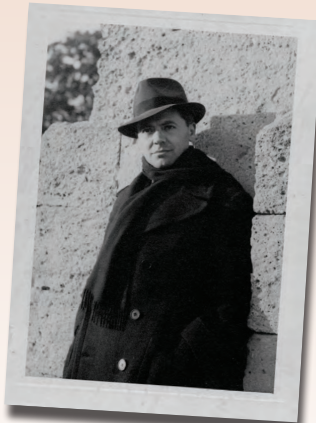
Photo : Jean Moulin aux Arceaux près de la promenade du Peyrou à Montpellier, photo prise par son ami d'enfance, Marcel Bernard, hiver 39-40. Crédits : Legs Antoinette Sasse, Musée du général Leclerc/Musée Jean Moulin (Ville de Paris).

Il décède des suites de ces mauvais traitements, probablement le 8 juillet 1943 en gare de Metz, lors de son transfert en Allemagne.