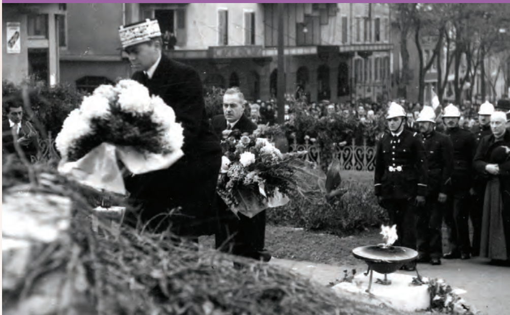
Peu après son arrivée le 21 mars 1937 à Rodez comme préfet de l'Aveyron, Jean Moulin dépose une gerbe au monument de la place d'armes, en hommage aux Morts de Rodez.

Aujourd'hui encore, plus de 380 établissements scolaires portent son nom, quatre musées lui consacrent des espaces spécifiques partout en France et des dizaines de monuments commémoratifs lui sont dédiés.