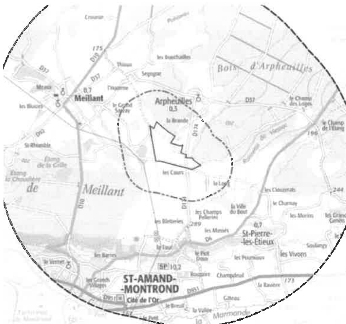
Illustration 1 : Localisation du site du projet

Le projet consiste en l'aménagement d'une centrale photovoltaïque au sol au lieu-dit « la Brande des Grands Cours » sur le territoire de la commune d'Arpheuilles dans le département du Cher.