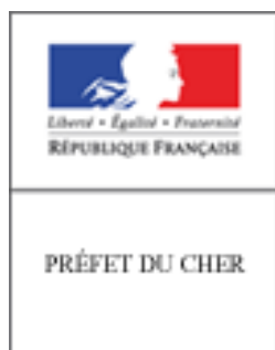
Schéma départemental d'accueil des gens du voyage 2016-2021