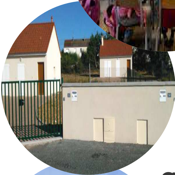
Schéma départemental d'accueil des gens du voyage