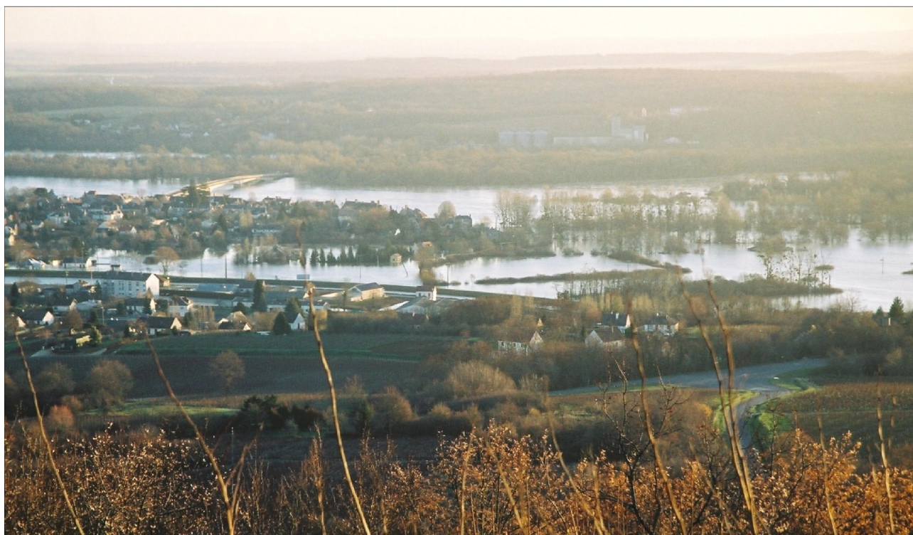
Saint-Satur - décembre 2003